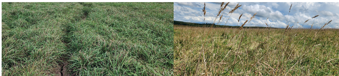
Foto2 - último Dactylis de Mejoramiento Nacional espigado, florecido y con restos secos febrero.

Estas diferencias en calidad y volumen de forraje producido en verano se deben a que nuevos Biotipos como LAZULY y LOVELY siguen vegetativos con continua emisión de hojas verdes que rebrotan rápidamente para retomar pastoreos temprano de enero y febrero. Pero con Dactylis convencionales (F2) los macollos que pasan a reproductivo mueren generando material seco.